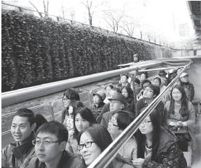
後楽園からの参加者は全部で15名、千代田区日中の会員を交えて、総勢38名が参加、最後に区役所の前で記念撮影をして解散となった。

千代田区日中では、4月6日に後楽園から中国留学生を招いて、恒例のお花見会を開催した。あいにく寒い日和であったが、九段下の韓国留学生を招いて、恒例のお花見会を開催した。