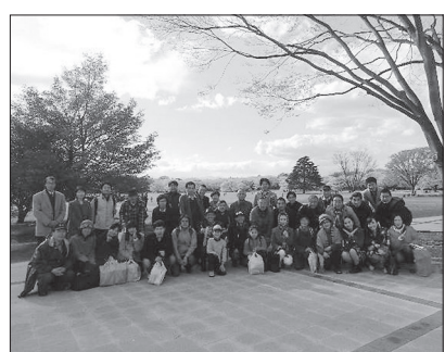
雨二モマケズ お花見で交流会

要請してある「提案は全体に将来性がない。東京も全国も協会の運営が民主的でない」「将来について総会等で議論していきいたい」「各委員会や地区の活動が全体化されていけない」「今後の課題として検討していきいたい」など、活発な議論が行われた。