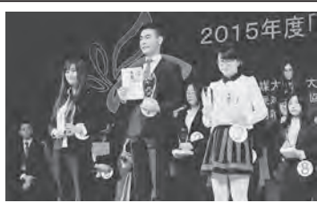
来日予定の上位入賞者3名

北京日本人会、日本人留学生など約1000人で埋まり、熱気に包まれていた。その中には天津から大型バス9台で駆けつけた500人の学生も含まれていた。