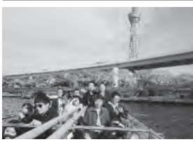
東京スカイツリーを背景に船上記念撮影

環境問題は共産党体制を脅かす社会問題である。そこでPM2.5の削減数値を決めて、自治体から市区町村や企業に割り当て徹底した取り組みをおこない。現在急激に大気汚染は改善されつつあるという。(高野)