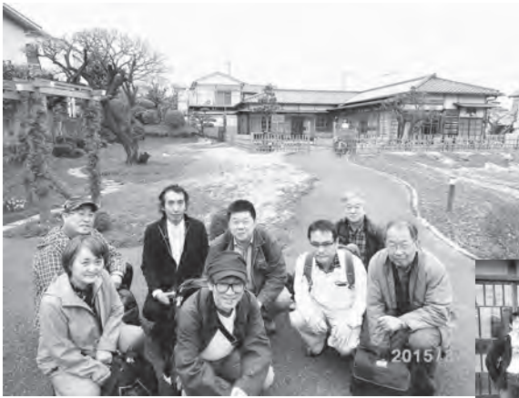
(上) 郭沫若記念館の前庭で (右) は郭沫若記念館の資料館で

3月29日、文化交流委員が主催して千葉市川市で「お花見ウォーキング」を行いました。天気予報では雨天ということで開催が危ぶまれましたが、当日はどうか天候ももち、参加者9名で実施しました。