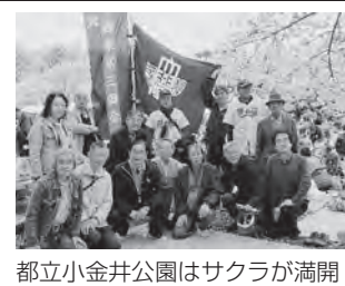
都立小金井公園は桜が満開

皆で持ち寄った沢山の料理、飲み物をいただきながら、歓談や交流、写真撮影をして二胡の演奏を大いに楽しんだ。