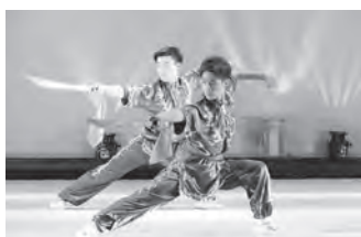
カンフー・アクションの演武

入っても楽しそうない声は絶えず、参加者一堂が友好の汗を流して交流を深めた1日だったが、飛び入りで参加した日本人の大学生グループもはじめて顔を合わせた中国人の若者とのスポーツを通じた交流に「とても楽しかった、また来年も参加したい」と語り、最後は日中の若者が一緒になつて体育館の清掃をする微笑ましい光景も見られた。(丸山)