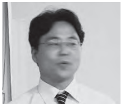
金 振 先生

アメリカ大使館が中国において大気質計測器を設置して、その数値をツイッターで流した。それが世界中に流れ中国政府とアメリカ政府の外交問